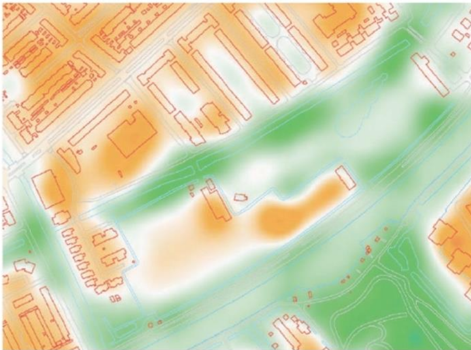
Figuur 2: Klimaatkaart 2019- Hete en koele delen in het huidige Roomburgerpark

Van de effecten van het inrichtingsvoorstel op de waterhuishouding ontbreekt een analyse in het inrichtingsvoorstel. Daarom zijn uitspraken over water en klimaatadaptatie nergens op gebaseerd.